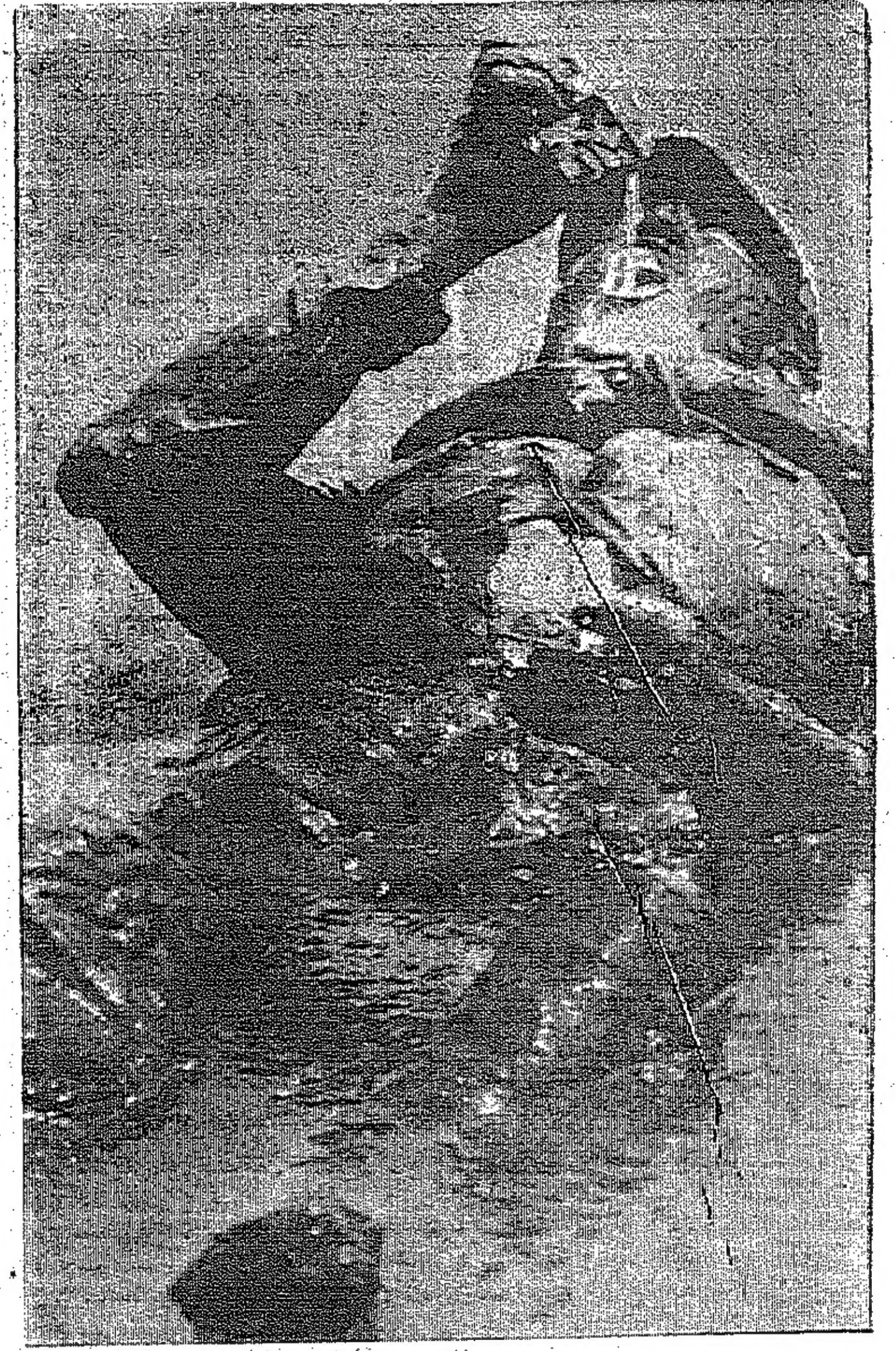
كوفية هذا البحار أثناء تدريبه نجاحه في احتمال ما هو فوق طاقة الانسان بعينين من الطيبه يفرغها في جوفه وهو في الوحل.

عندما كان في عام ١٧٧٥ م. وقد جاءت في حد كبير على نبط النظم البريطاني، ولكن الأمريكيين، ما لبثوا أن بزوا جميع منافسهم في هذا المضمار فجاءت قوتهم البحرية مزيجا عجيبا من الأسطورة والقوة. وتتلّف البحرية الأمريكية من متطوعين لا يبلغون، وهم يوتقون عقد الاستخدام - ماذا ينتظرون وماذا تجني لهم الأيام من عناء وشقاء.